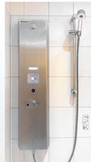
Moderne Duschen mit Handbrause und Start-Stopp-Taste