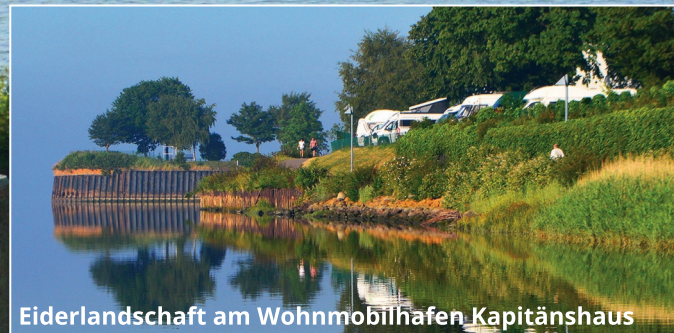
Eiderlandschaft am Wohnmobilhafen Kapitänshaus